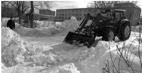
• Minns våren 2011...