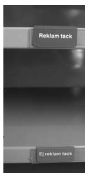
• Ja eller nej till reklam väljs enkelt med en vändbar bricka.

– Visst slipper jag att springa i trapporna. Å andra sidan får jag räkna med att få ett större utdelningsdistrikt. Så i praktiken vinner inte jag personligen någon tid på den här model-