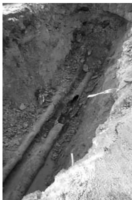
• Avloppsrör skadat av trärötter.

Några dagar senare var dock allt klappat och klart och tvättstuga och avlopp var i gång igen. Notan gick på ca 75.000 kr.